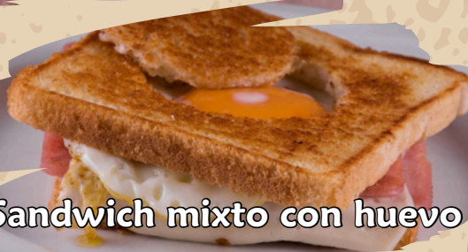
Sandwich mixto con huevo