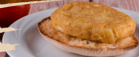
Tortillete (premiado 2015)